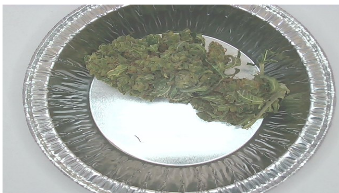
Bild der eingelangten Probe vom 18.08.2022