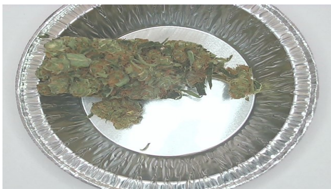
Bild der eingelangten Probe vom 18.08.2022