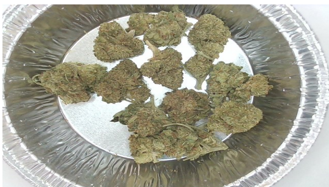
Bild der eingelangten Probe vom 01.08.2022