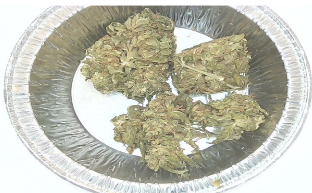
Bild der eingelangten Probe vom 18.08.2022