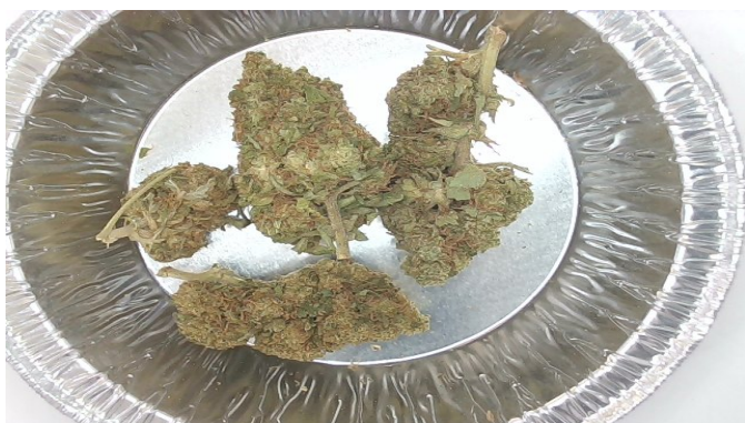
Bild der eingelangten Probe vom 01.08.2022