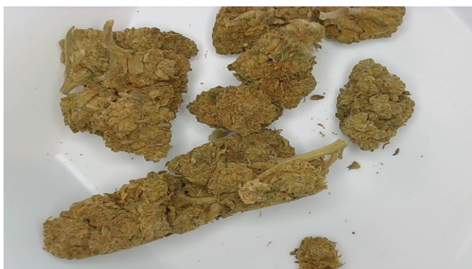
Bild der eingelangten Probe vom 28.10.2022