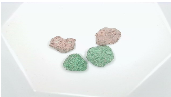
Bild der eingelangten Probe vom 27.09.2022